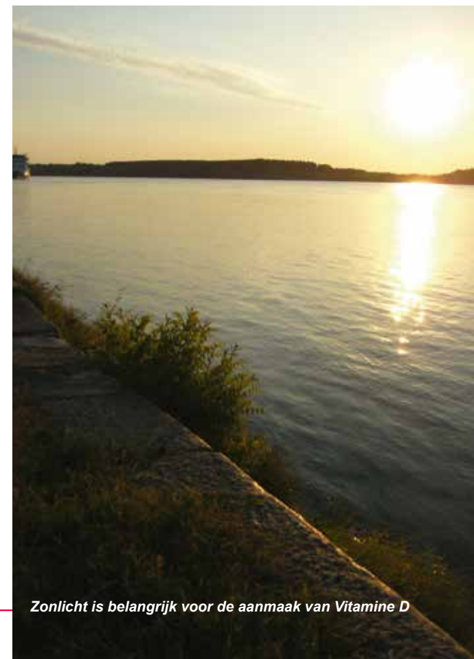
Zonlicht is belangrijk voor de aanmaak van Vitamine D